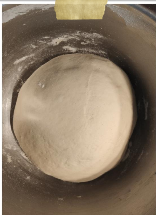
Testo pred vzhajanjem