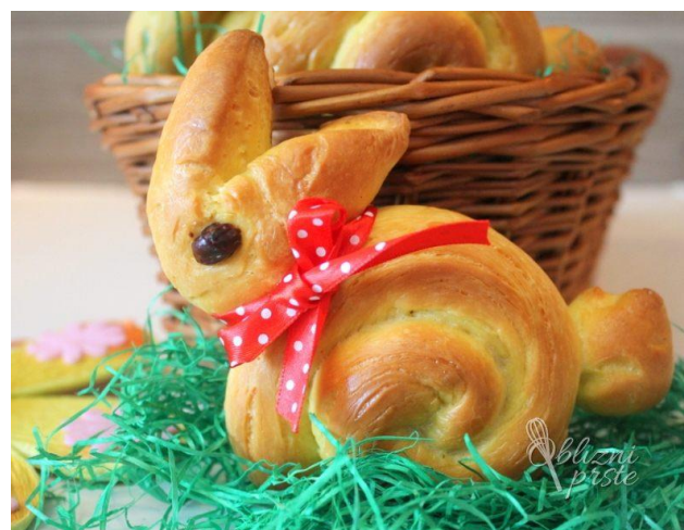
ZAJČEK 1: En svaljek zavijemo v obliki polžka. Drug kos testa oblikujemo v obliki solze, katerega prerežemo, da dobimo ušesa. Naredimo manjšo kroglico za repek. Za oko lahko uporabimo rozino, oreh, brusnico,...