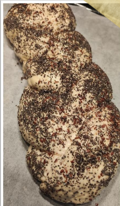
Pletenica s semeni pred peko