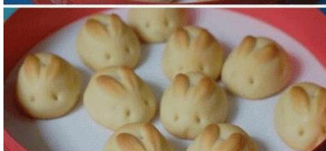
ZAJČEK 2: Iz testa naredimo kroglico, ki jo zarezemo kot kaže slika.