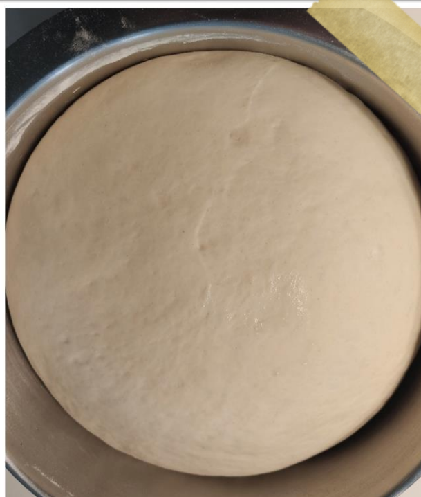
Prostornina testa po vzhajanju se poveča