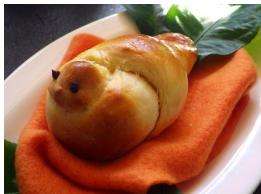
PTIČEK: Iz testa naredimo svaljek, ga zavozlamo, oblikujemo rep in kljunček. Za oko uporabimo nageljnovno žbico.