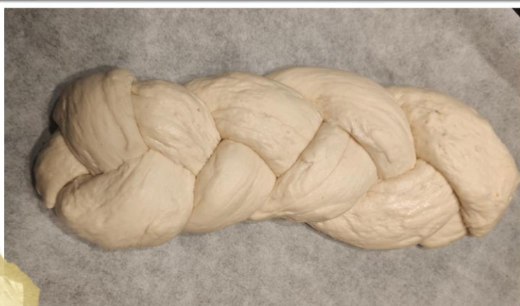
Pletenica pred drugim vzhajanjem