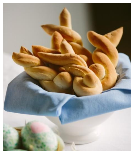
ZAJČEK 3: Iz testa oblikujemo 1 daljši svaljek, katera zvijemo kot prikazuje slika. Manjšo kroglico uporabimo za repek.