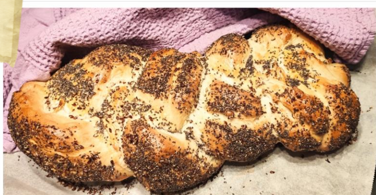
Pečena pletenica – končni izdelek