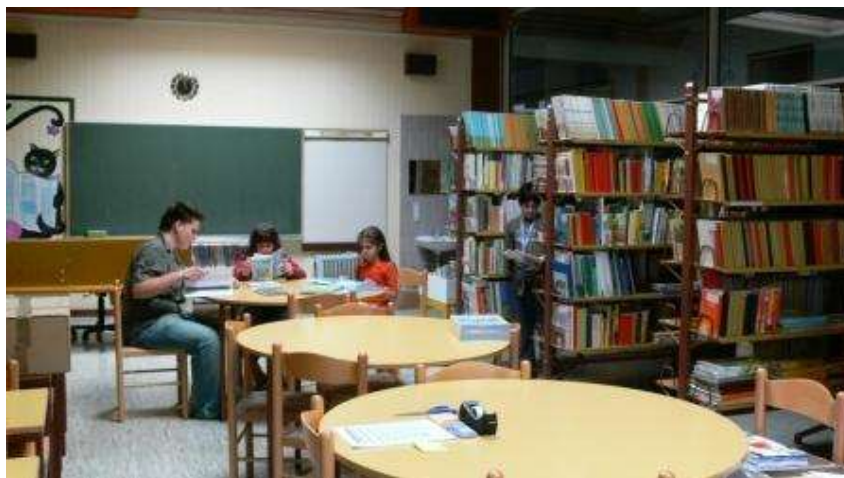
Slika 18: Šolska knjižnica

Že v samih začetkih osnovne šole Tone Čufar je delovala knjižnica - izposoji so vodili kar učitelji sami ali pa administrativni delavci. V sedemdesetih letih je delo knjižničarke prevzela Vladka Platiša, ki še danes uspešno vodi knjižnico, pri izposoji pa ji pomaga Irena Leskovšek.