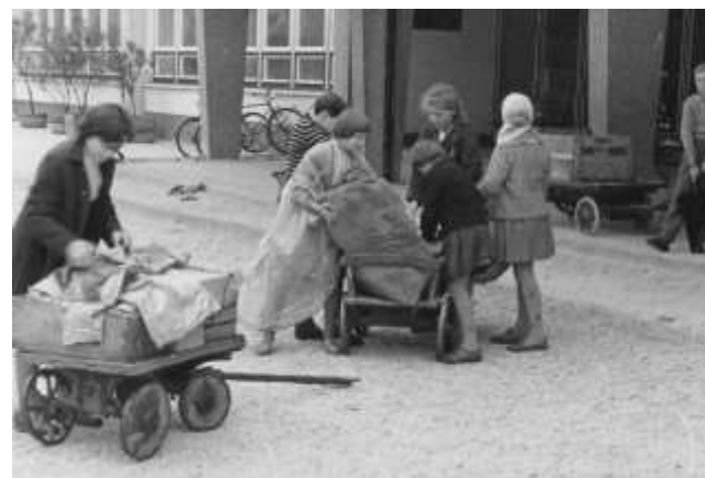
Slika 9: Papirna akcija