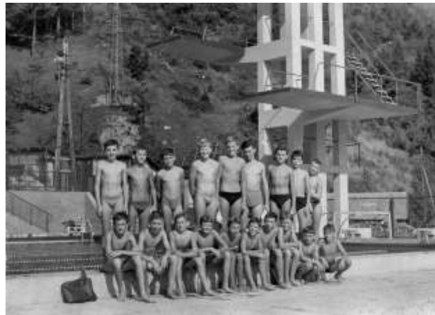
Slika 7: Športni dan na bazenu Ukova