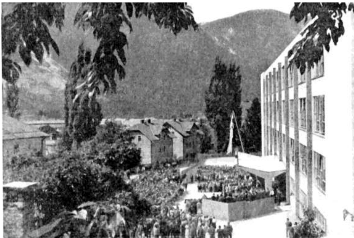
Slika 5: Otvoritev nove šole na Jesenicah

Leta 1959/60 je bila zgrajena nova šola (OŠ Prežihovega Voranca) na Jesenicah. Stavba je bila razdeljena: v polovici proti Plavžu je bila Vorančeva šola, druga polovica pa Čufarjeva šola. Že naslednje leto - 1960/61 so nekateri učenci šole Tone Čufar morali gostovati v stavbi Gimnazije, ker je bila šola že premajhna.