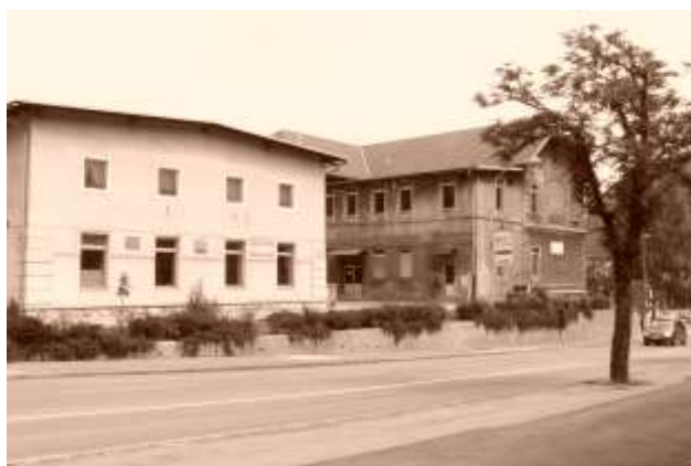
Slika 1: Čistilnica - 1. razred

O prvih zametkih naše osnovne šole govorimo od 1. septembra 1957, ko se je imenovala Osemletka Tone Čufar. Takrat je pouk potekal v različnih stavbah. Prvi razred je bil v prostorih današnje čistilnice, zraven je bil prizidek, v katerem je bilo nekaj učilnic in telovadnica. V stavbi (današnji Antus, nekdanje »jasli«) poleg današnjega Delavskega doma (pri Jelenu) nasproti glavnega vhoda v Železarno so pouk obiskovali učenci drugega razreda. V letu 1957 so bili na Čufarjevi šoli le razredi od 1. do 4., v naslednjih letih je šola postopoma pridobivala razrede do 8.