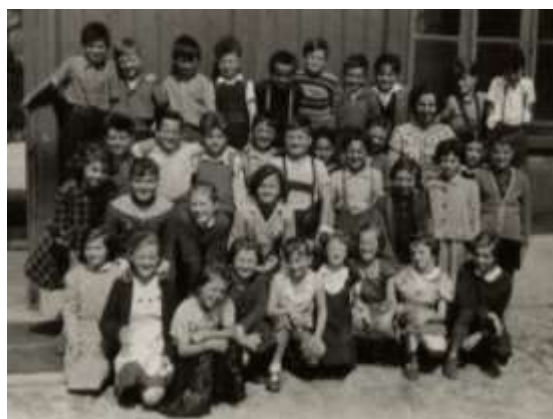
Slika 2: Antus - učenci 2. razreda