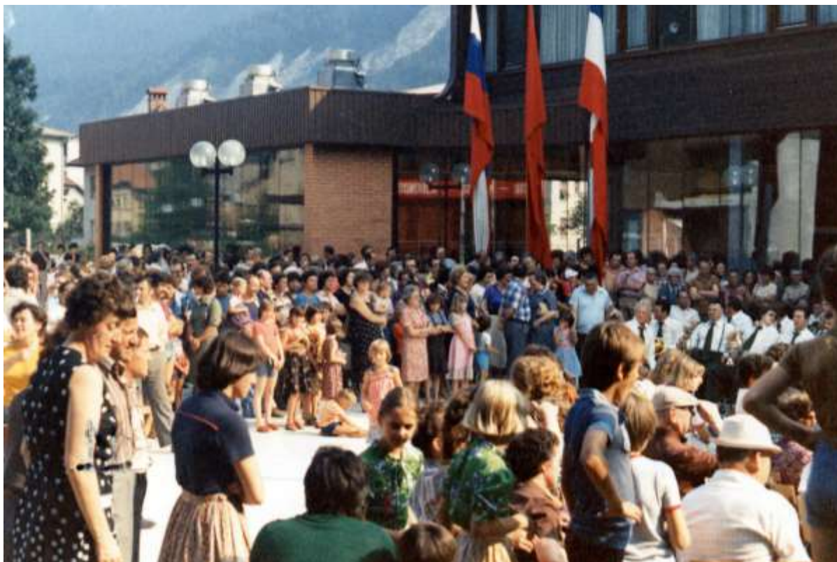
Slika 12: Otvoritev