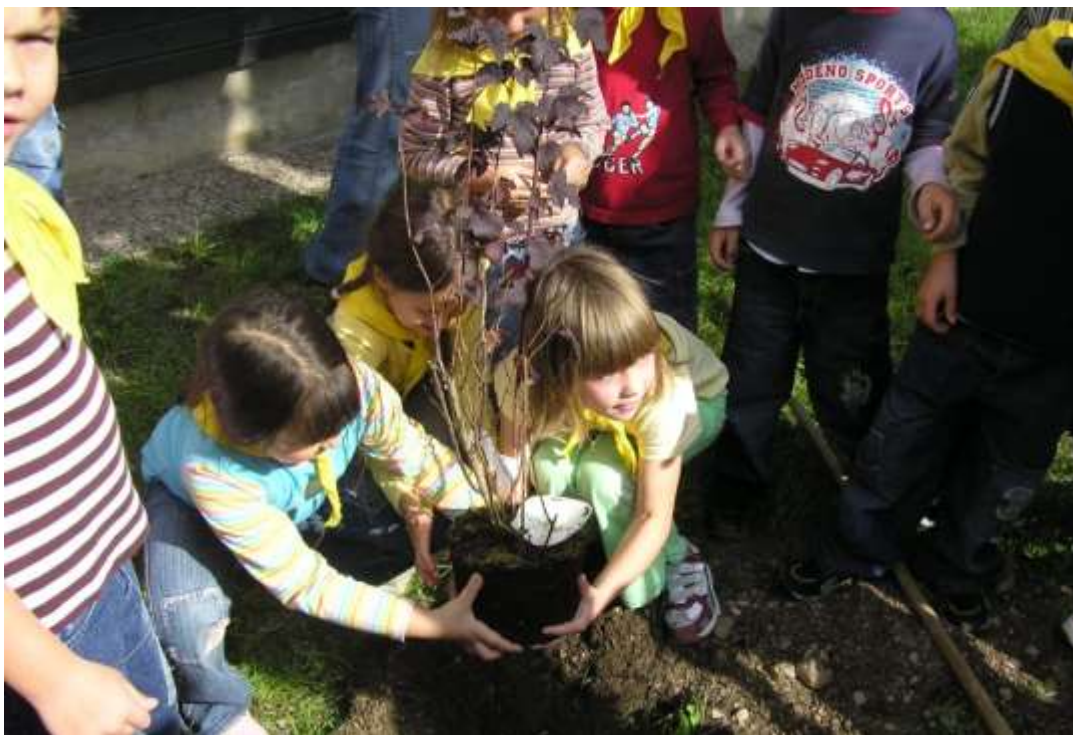
Slika 21: Sadimo drevo (projekt Unesco)

Osnovna šola Toneta Čufarja Jesenice je v zadnjih letih vključena v različne projekte, med drugim: Zdrava šola, Unescova šola, FIT Slovenija, Korak k sončku ... V zadnjih letih smo navezali stike s šolo v Avstriji, s katero sodelujemo v različnih projektih. Učencem nudimo pestro izbiro interesnih dejavnosti, ki jih izvajajo naši učitelji, nekatere pa že nekaj let uspešno vodijo zunanji sodelavci.