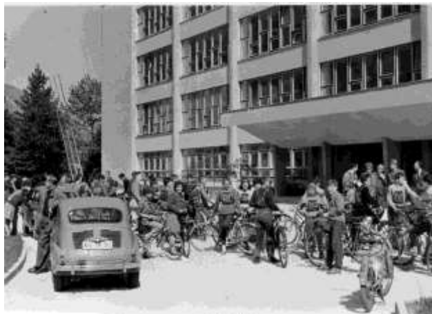
Slika 6: Kolesarski izpit