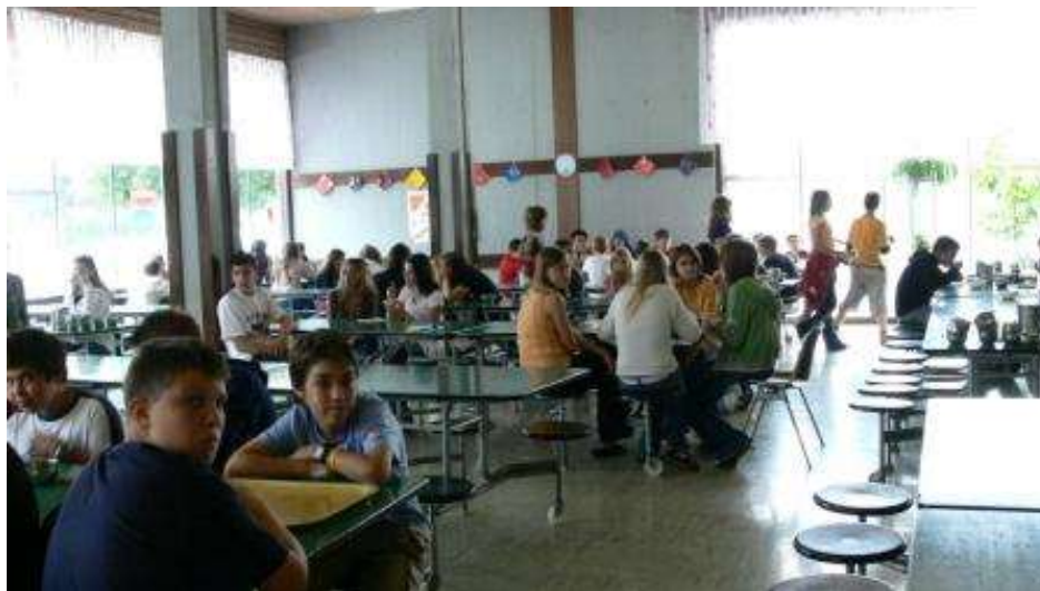
Slika 20: Jedilnica