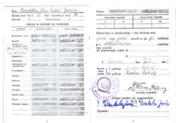
Slika 3 in 4: Spričevalo iz šol. leta 1957/58