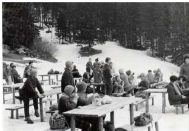
Slika 8: Športni dan v Španovem vrhu