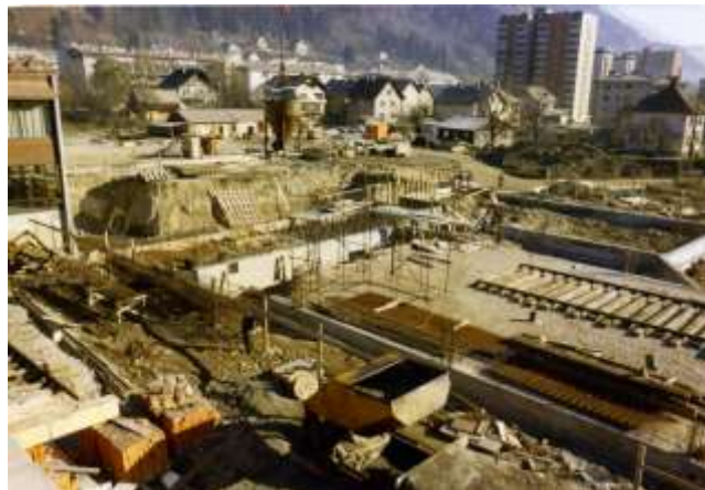
Sliki 10 in 11: Gradnja nove šole